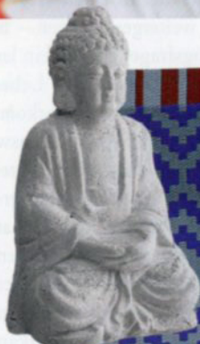
Buddha aus Zement ca. 35 Fr. von Interio