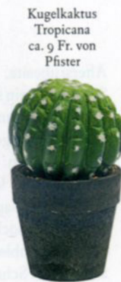
Kugelkaktus Tropicana ca. 9 Fr. von Pfister