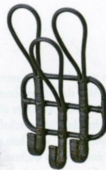
Wandhaken Nipprig aus Rattan ca. 7 Fr. von Ikea