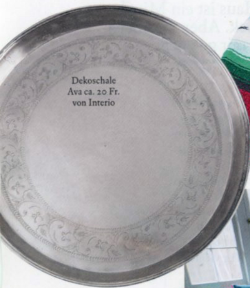
Dekoschale Ava ca. 20 Fr. von Interio