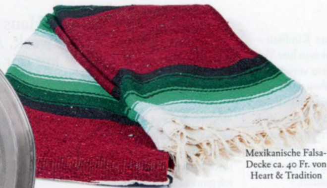
Mexikanische Falsa- Decke ca. 40 Fr. von Heart & Tradition