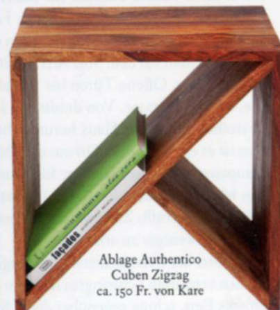
Ablage Authentico Cuben Zigzag ca. 150 Fr. von Kare