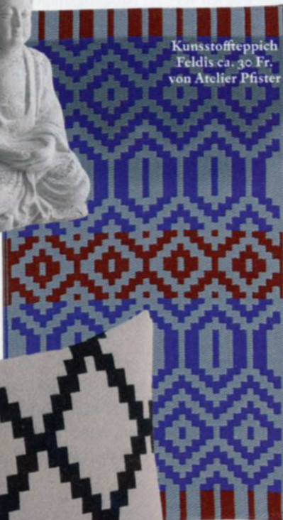
Kunststoffteppich Feldis ca. 30 Fr. von Atelier Pfister